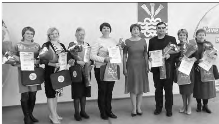
Лауреаты премии главы

ского детского сада. Развивая творческие способности детей, она создала в детском саду учебно-методический комплект: различные дидактические игры, музыкально-игровые упражнения,