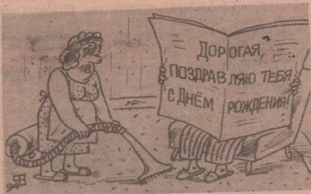
Рисунок В. Федорова.