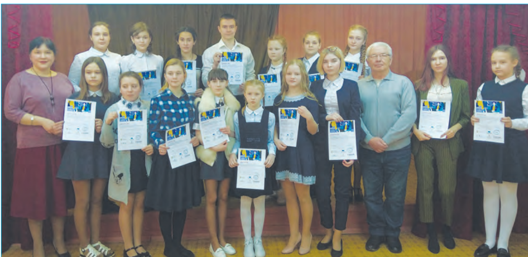
Юные чтецы демонстрировали свою любовь к классической литературе