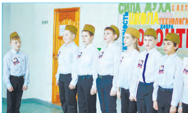
Школьники района показали себя в строевой подготовке