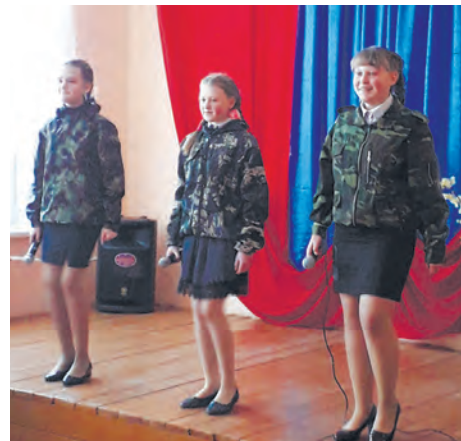
В Травянском ДК мужчин поздравляли маленькие артисты