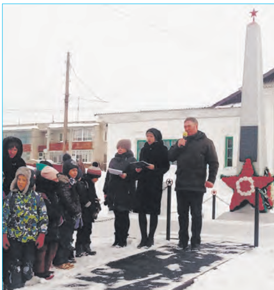
В Кисловском собрались на митинг у обелиска павшим воинам