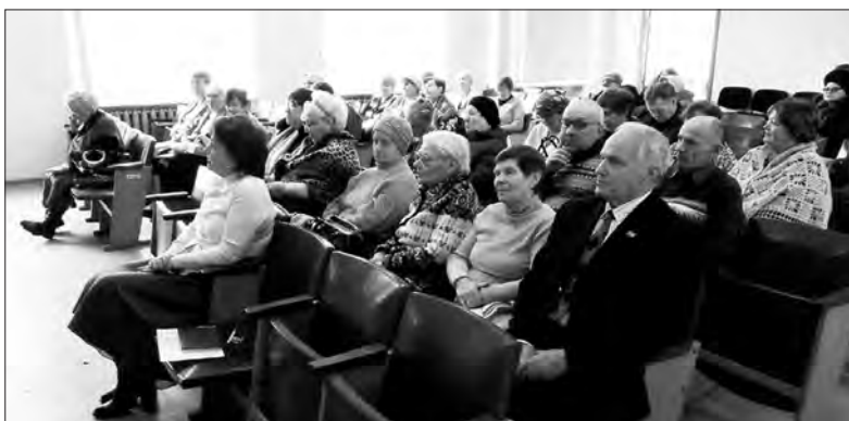
Диалог общественников с представителями районной власти был полезен для всех

Обсуждали ветераны и тему перехода на цифровое телевидение. Заместитель