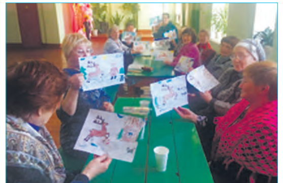
Участники клуба «Золотой возраст» рисовали по мотивам сказа Бажова