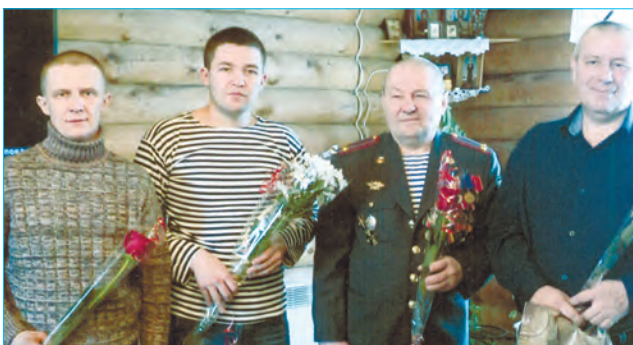
В Барабановском поздравили каждого героя – участника локальных действий

21 февраля в Бродовском клубе прошел праздничный концерт, посвященный мужественным защитникам Отечества.