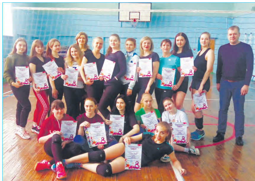
Призеры районного турнира по волейболу среди женских команд