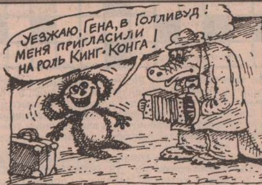
Рисунок К. Мальцева