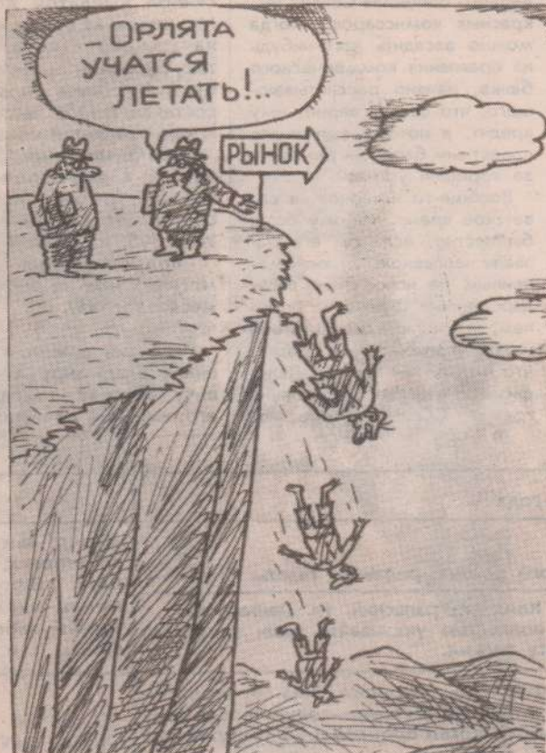
Рисунок В. Федорова.