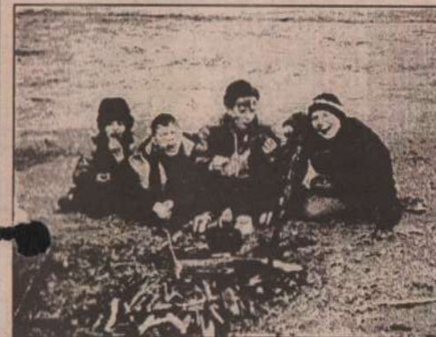
4. Родители в поход снарядили. Пятый день доесть не можем.