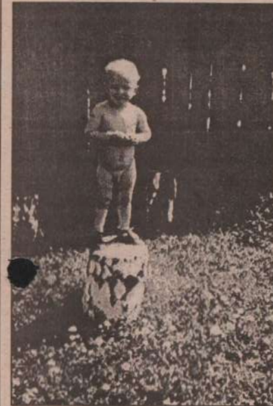
1. Подумаешь, голый. Дите я, мне можно. Я может, ровный загар получить хочу.