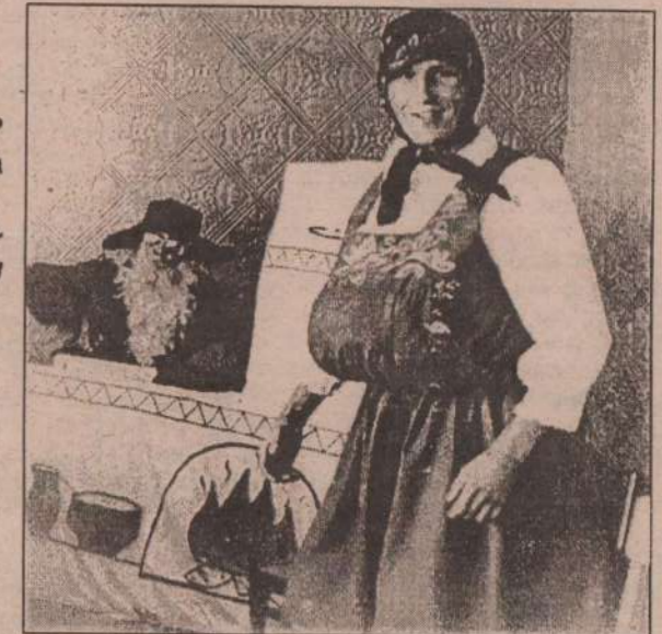
2. Это я-то бабушка? Я баушка. Дедушка вон на печке.

(А.Р. Корпухин, преподаватель химии с. Травянское)