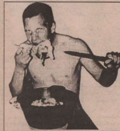
5. Когда еще пельмени готовы будут. А я есть хочу страшно.