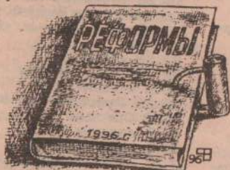
Рисунок В. Федорова.

Как сообщил начальник полиции А. Н. Городницкий, ими доначислено более 29 млрд. рублей. Часть этих денег взыскана, в том числе «живым» рублем.