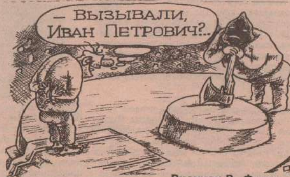
Рисунок В. Федорова.