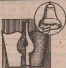
Редактор С. Трофимов