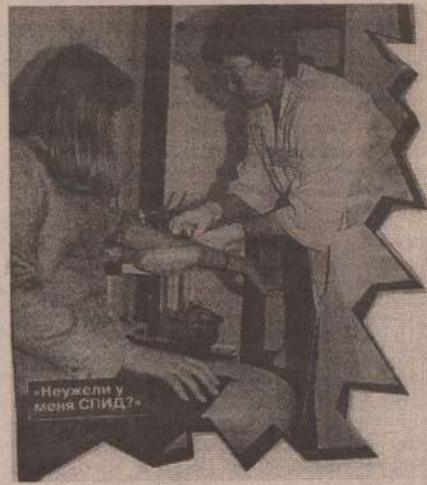
«Нужна ли у меня СПИД?»

тоями, оказалось не готово к сексуальной раскрепощенности. В наиболее незащищенную от соблазнов и их последствий категорию попадают дети, школьники-подростки. Чрезвычайно высок процент среди заболевших 13-17-летних. А ведь это именно тот возраст, когда происходит половое созревание организма. Венерическая инфекция, кроме серьезной душевной травмы, наносит колоссальный вред здоровью молодого человека. И в первую очередь это отражается на детородной функции - сифилитик зачастую рискует остаться бездетным. Поражает болезнь органы зрения, слуха, приводит к разложению костей и нарушению центральной нервной системы. Нередки среди запущенных больных умственные отклонения и параличи.