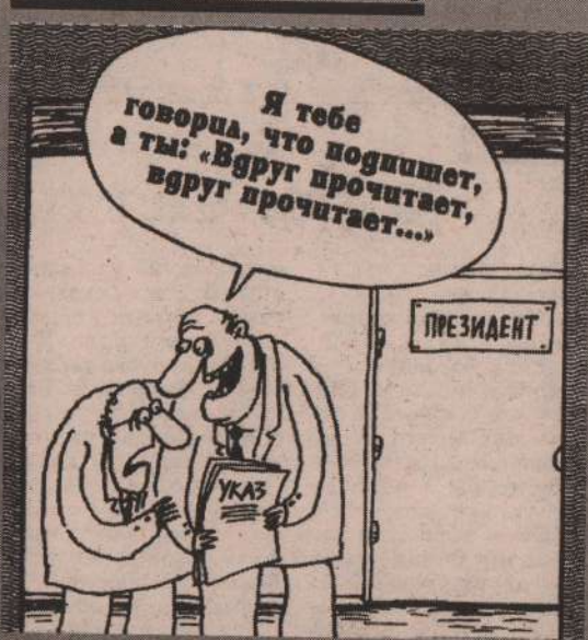
Рисунок В. Шилова.

В (Начало на 1 стр.) тям. Не исключено, что вспомнят про фермера Гарста, посоветуют побывать в Америке и воочию убедиться, как здорово там хозяйствуют на земле частники.