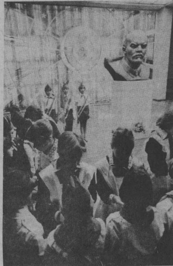
Прием в пионеры.

В решении конференции-диспута пионеры записали взять за основу действий пионерской организации района решения 9-го Всесоюзного пионерского слета.