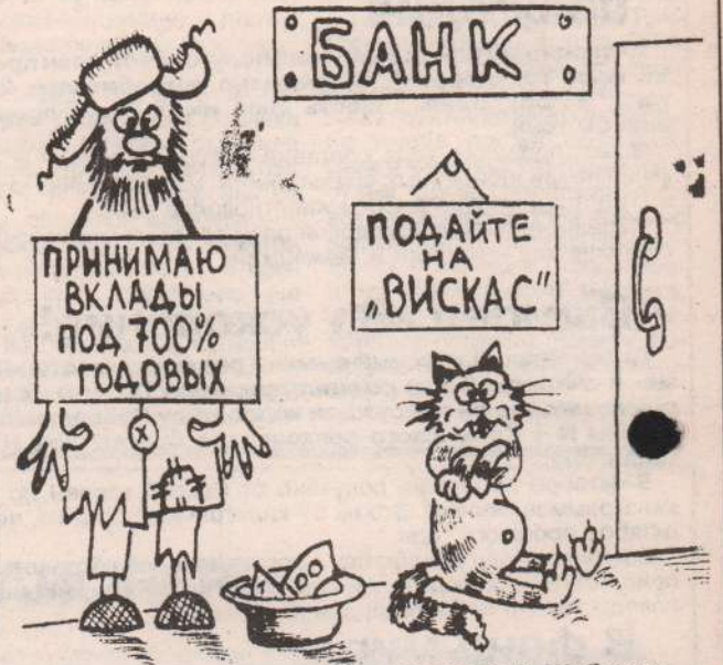
Рисунок В. Жабского.