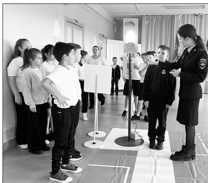
Группа по пропаганде Отдела Госавтоинспекции Каменска-Уральского

Сотрудники ГИБДД провели с учащимися 1-4 классов Бродовской школы практическое занятие по отработке навыков безопасного перехода проезжей части на учебно-тренировочном перекрестке.