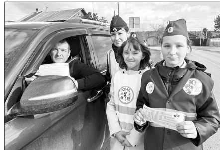
Группа по пропаганде Отдела Госавтоинспекции Каменска-Уральского

С 20 сентября юные инспекторы Каменской школы начали «путешествие» по начальным классам.