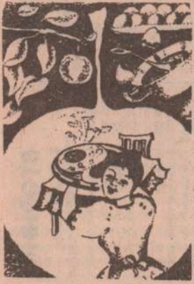
Салат из шампиньонов

Шампиньоны промыть и отварить в подсоленной воде. Охладить и нарезать ломтиками. Сваренные вкрутую яйца нарезать кубиками. Соединить с грибами, заправить уксусом и растительным маслом. Салат посыпать зеленью петрушки или укропа.