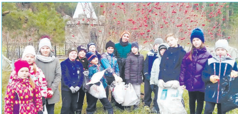
Юные экологи из Каменской школы