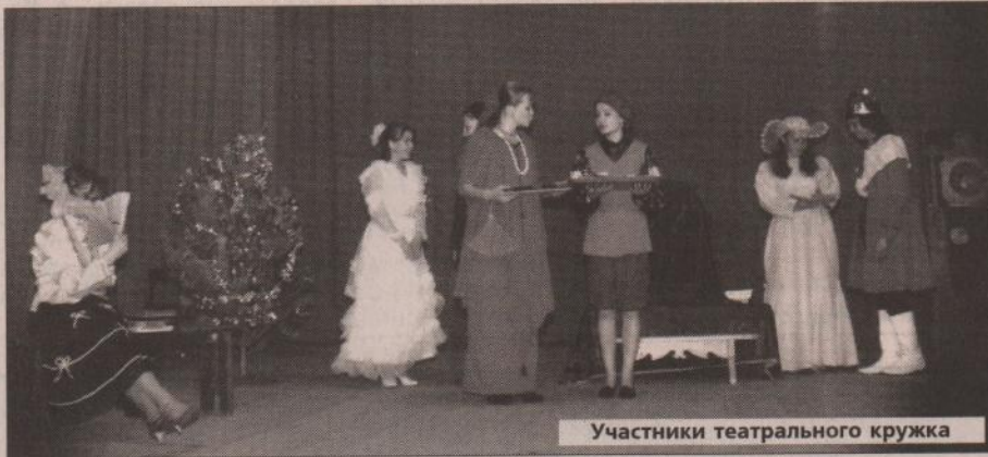
Участники театрального кружка