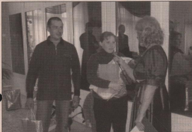
Делясь своей радостью

30 мая, накануне Дня защиты детей, в районном ЗАГСе состоялась торжественная регистрация новорожденных.