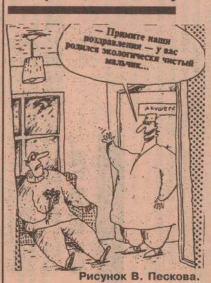
Рисунок В. Пескова.