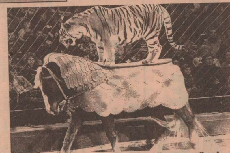
На нас "наезжает" тигр. Встречайте!