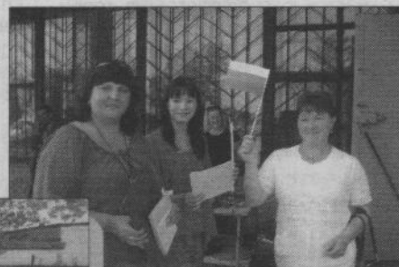
На праздновании в пос. Мартюш

В августе 1991 года первый Президент Российской Федерации Б. Ельцин издал Указ: «...В связи с восстановлением 22 августа 1991 года исторического российского трехцветного государственного флага, овеянного славой многих поколений россиян, и в целях воспитания у нынешнего и будущих поколений граждан России уважительного отношения к государственному символу постановляю: установить праздник День Государственного флага Российской Федерации и отмечать его 22 августа...»