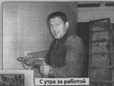
С утра за работой

борьем, бодибилдингом, армрестлингом, гиревым спортом.