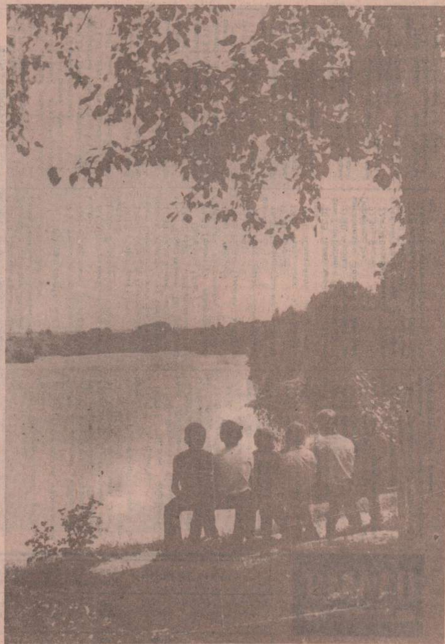
О чем им, интересно, думается?