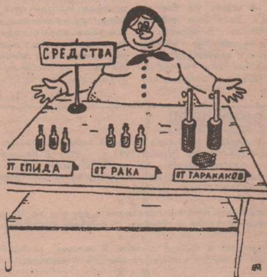
Рис. Е. МИТРОШИНА.