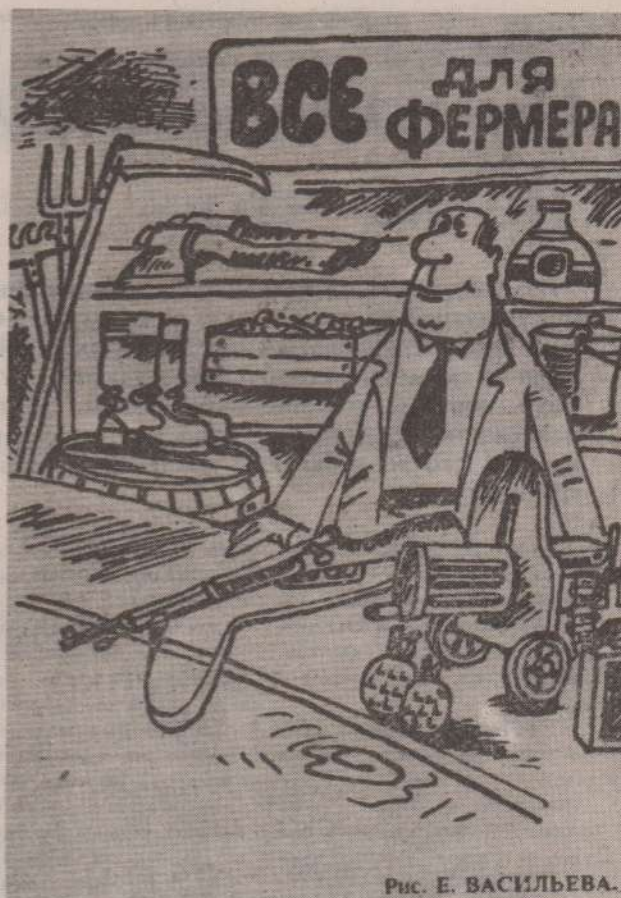
Рис. Е. ВАСИЛЬЕВА.