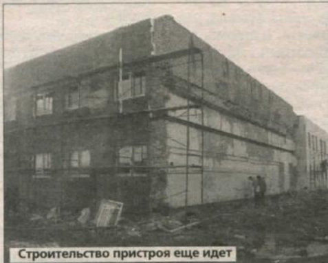
Строительство пристроя еще идет

уж и много. На второй же день пребывания в приюте они должны будут выйти на работу. У Центра будет подсобное хозяйство. Уже выделены земли в п. Лебяжье, где можно выращивать картофель, морковь, свеклу и другие