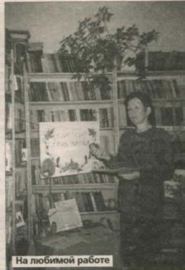
На любимой работе