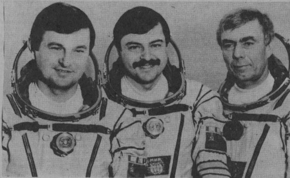
На снимке — первый экипаж космического корабля «Союз ТМ-4» (слева направо) командир экипажа летчик-космонавт СССР В. Г. Титов, бортинженер М. Х. Манаров и космонавт-исследователь, заслуженный летчик-испытатель СССР А. С. Левченко в Центре подготовки космонавтов имени Ю. А. Гагарина.