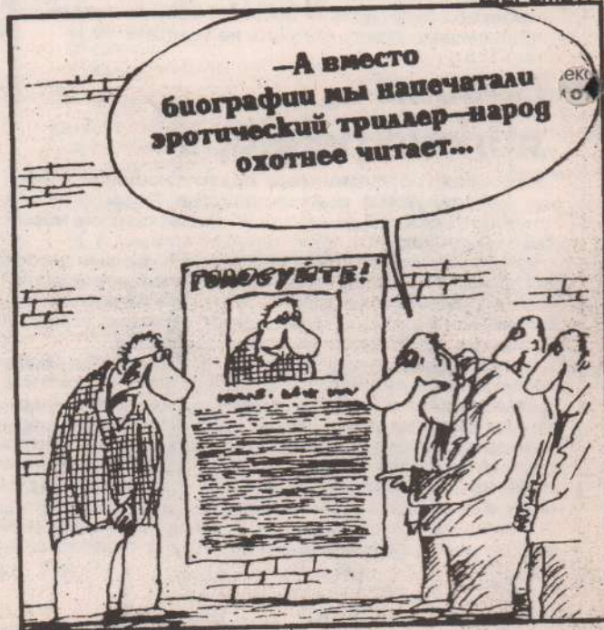
рис. В. Шнупа (С.-Петербург)