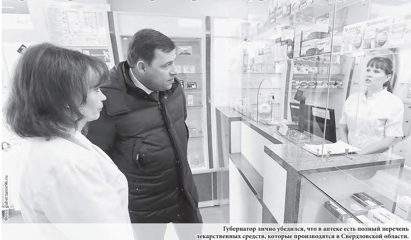
Губернатор лично убедился, что в аптеке есть полный перечень лекарственных средств, которые производятся в Свердловской области.

Губернатор области Евгений Куйвашев в середине ноября посетил в Екатеринбурге одну из аптечных сетей, где оценил формирование цен на жизненно важные лекарства и наличие необходимого ассортимента препаратов, которые должны быть в каждой аптеке.