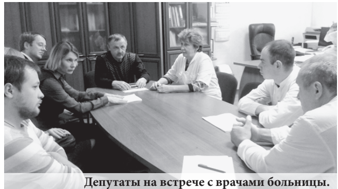
Депутаты на встрече с врачами больницы.

По словам депутата, больница в Бисерти является одной из образцовых среди сопоставимых по численности жителей территорий. Это полноценный больничный комплекс с поликлиникой, стационаром, педиатрией, роддомом и скорой помощью.