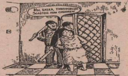
Рис. В. РАНИХ.