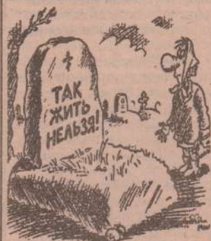
Рис. В. МНЛЕЙКО (г. Санкт-Петербург).