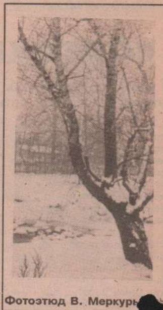
Фотоэтиюд В. Меркурьев