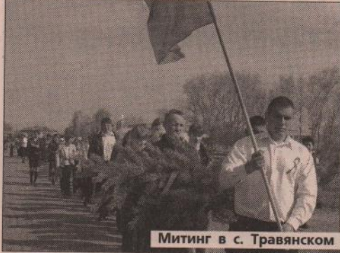
Митинг в с. Травянском

Ежегодно в начале мая в России чтят память о тех, кто защищал нашу Родину в то грозное время. И слава героев будет жить, пока живет человеческое слово. Быстро летит время, уходят от нас ветераны. Сегодня на территории Травянской сельской администрации их осталось лишь трое.