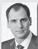
Денис Паслер, председатель правительства Свердловской области:

По словам председателя правительства области Дениса Паслера, благодаря ответственному труду педагогов регион находится в числе лидеров по успешной сдаче ЕГЭ. Показатели среднего тестового балла по 9 из 11 предметов, а также доля «стобалльных» работ – выше общероссийского уровня. 132 работы по разным предметам набрали максимальный балл. При этом сами областные показатели баллов ЕГЭ в 2015 году по сравнению с предыдущим годом выросли практически по всем предметам.