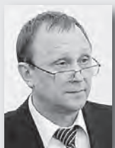
Александр Соболев, директор департамента государственной политики в сфере высшего образования Министерства образования и науки РФ:

Свердловская область названа одним из лидеров в сфере образования в стране. Такую высокую оценку усилиям региональной власти по повышению доступности и качества образования дал директор департамента государственной политики в сфере высшего образования Министерства образования и науки РФ Александр Соболев в ходе традиционного ежегодного педагогического совещания.