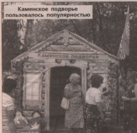
Каменское подворье пользовалось популярностью

На празднике выступали творческие коллективы района. Под всеобщие аплодисменты Сипавский народный хор исполнял песни. Супруги Дерновы из д. Брода - веселые гостюшки. Артисты в русских народных костюмах привлекали внимание прохожих. Некоторые из них начинали подпевать и лихо подплясывать в такт музыке.