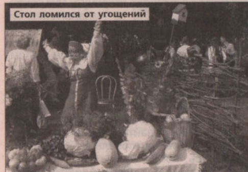
Стол ломился от угощений