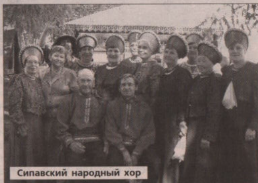
Сипавский народный хор