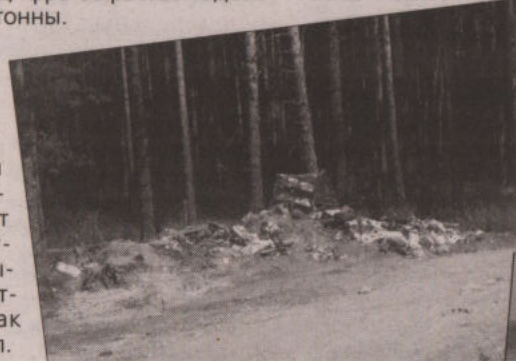
И это все наших с вами рук дело!

«Ребята садили саженцы, – рассказывает глава