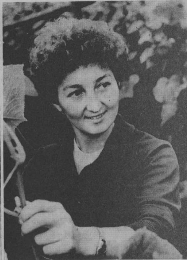
ЧЕЛОВЕК И ЕГО ДЕЛО

Нужно признать, что подготовка к зиме требует немалых финансовых затрат, ручного труда. Деньги на эти цели есть, а вот с кадрами ремонтников сложнее. Но на объекты соцкультбыта направили силы жилищно-коммунального отдела завода и стройцеха, а производственные поме-