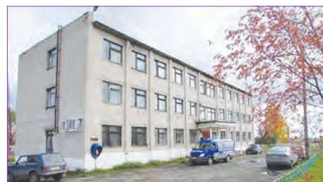
Бывшее здание конторы совхоза им. Ленина

Предприятие также занимается растениеводством, главным образом стараясь обеспечить кормами животных. Отрасль животноводства в полном объеме обеспечена грубыми и сочными кормами собственного производства. В 2018 г. произведено валовой продукции в действующих ценах на сумму 79 млн. руб., что составило 103% к уровню 2017 г.