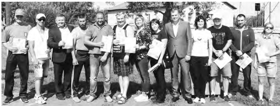
Активисты спортивного движения района получили награды