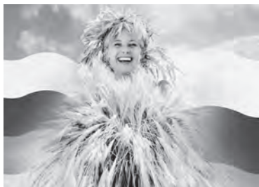
Эмбарго – не помеха АПК