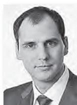
Денис Паслер, председатель правительства Свердловской области:

– Устойчивое развитие уральского агропрома сегодня важно как никогда. Перед работниками сельского хозяйства и перерабатывающей промышленности стоит задача максимального импортозамещения продовольственной продукции. Уверен, что мастерство, высокий профессионализм и добросовестный труд уральцев позволят успешно решить все самые трудные задачи.