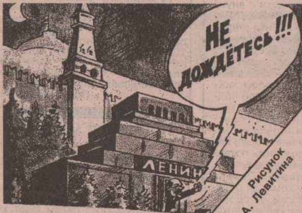
Рисунок А. Левитина