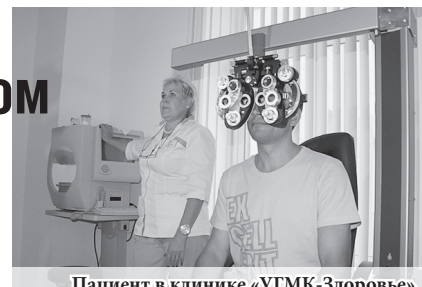
Пациент в клинике «УГМК-Здоровье»

Оренбургские врачи смогли ознакомиться с организацией современной лучевой диагностики, увидели стройку второй очереди