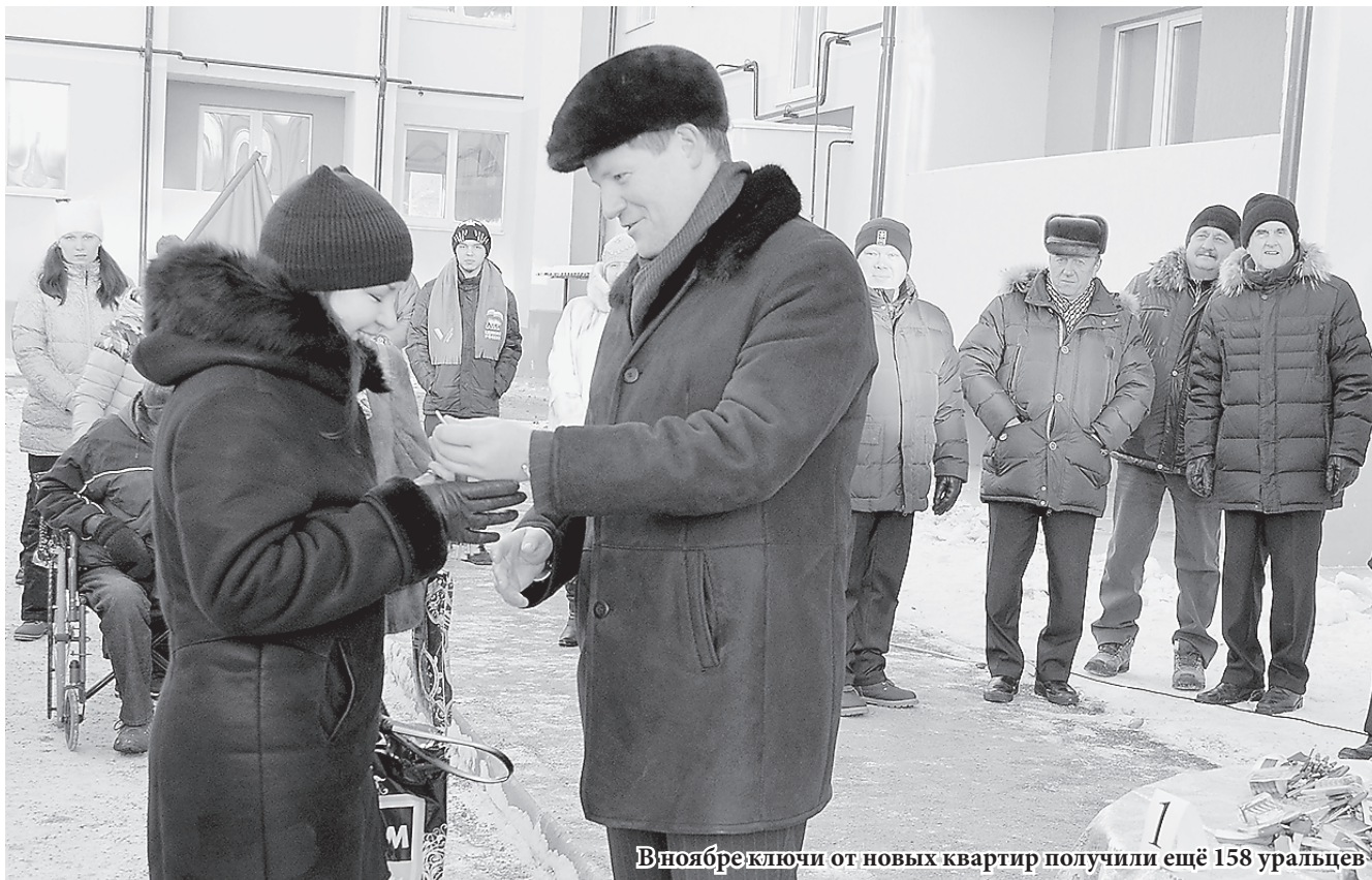
В ноябре ключи от новых квартир получили ещё 158 уральцев

В Свердловской области введены в эксплуатацию еще 2 многоквартирных дома для расселения аварийного жилья. Ключи от новых квартир получили 158 человек, сообщили в региональном министерстве энергетики и ЖКХ.