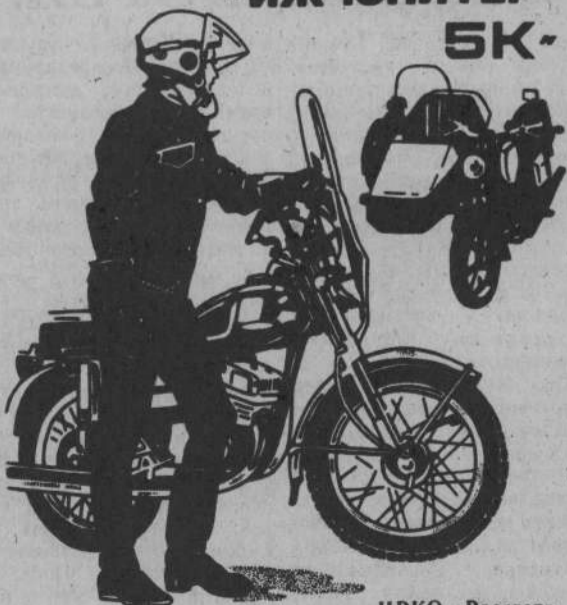
ЦРКО «Рассвет». Рекламное агентство ЦОРПО «Золотое кольцо».