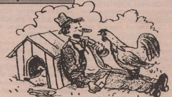
Рис. В. Литовченко.

- Что, Барбос, не узнаешь своего хозяина?