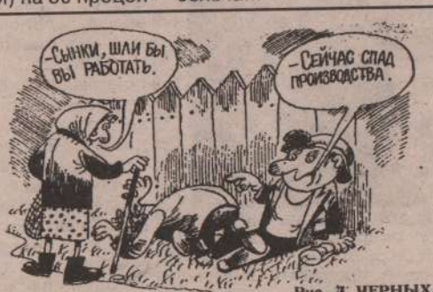
Рис. Л. ЧЕРНЫХ.