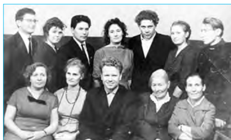
Педагоги Маминской школы в 60-е гг.