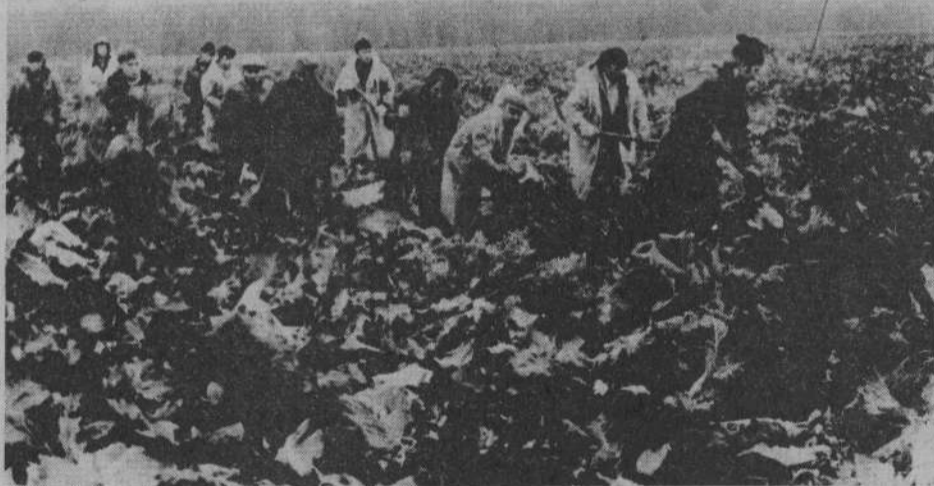
СТУДЕНТЫ НА УБОРКЕ УРОЖАЯ