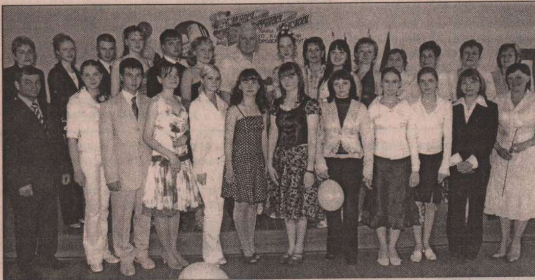
В целях поддержки престижа образования в рамках реализации районной программы «Одаренные дети» в районе с 2000 года разработано положение о «Премии главы МО «Каменский городской округ». По итогам 2006-2007 учебного года Премией награждены 18 учащихся, 6 педагогов, 3 специалиста Управления образования