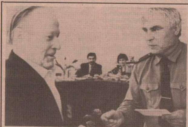
Вручение медалей маршала Жукова ветеранам Великой Отечественной войны нашего района.

На последнем заседании районной избирательной комиссии по выборам Президента Российской Федерации утверждены составы 31 участковой комиссии, а также образцы приглашений. Рассмотрен проект сметы расходов, необходимых для проведения выборов на территории района. Предполагается, что последние выльются в 145 млн. рублей. Эта сумма не окончательная, поскольку последнее слово за Центральной избирательной комиссией.