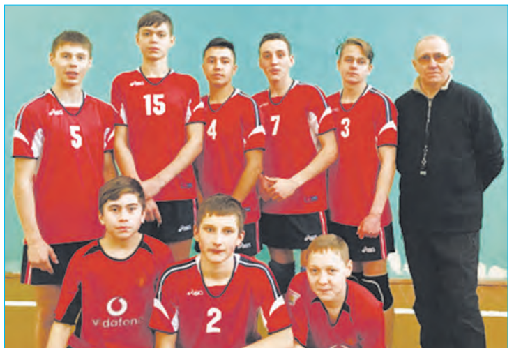
Чемпионы района по волейболу – команда из Маминского