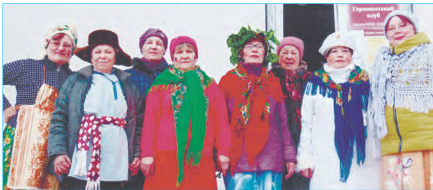
В Горноисетском клубе весенние праздники провели с размахом