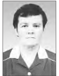
Дочь, муж, внуки, родные