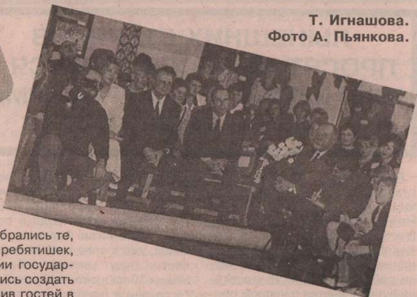
Т. Игнашова.

Районный детский дом отметил 5-летний юбилей.