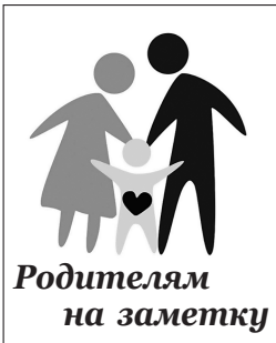
Родителям на заметку

Ребенок не бережет свои вещи по нескольким причинам: