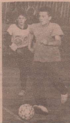
На снимке: момент игры.