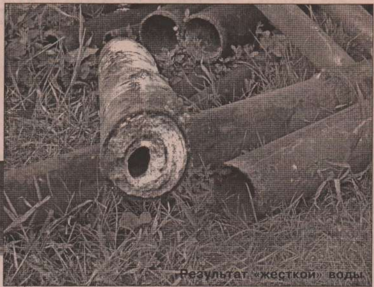
Результат «жесткой» воды

дний по счету, пятый котел. Таким образом, в котельной полностью завершена реконструкция и в новом отопительном сезоне начнут работать все котлы.