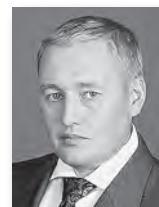
Андрей Альшевских, депутат Госдумы РФ:

«У нас большие долги по программе предоставления жилья детям-сиротам, около трёх тысяч нуждающихся. Есть проблемы с финансированием газификации территорий, нужны дополнительные средства на строительство спортивных сооружений около школ. Проблем много, но мы надеемся на дополнительные средства из федерального бюджета».