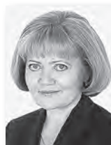
Людмила Бабушкина, председатель областного Заксобрания:

«Сейчас мы возвращаемся к трёхлетнему периоду планирования. Думаю, что первый год будет непростым в части формирования и исполнения бюджетов. Мы должны аккуратно подойти к планированию доходной и расходной частей бюджета. Взвешенная бюджетная политика всегда позволяла области выполнять все социальные обязательства».