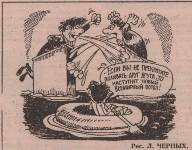
Рис. Л. ЧЕРНЫХ.

К старости Михаилы становятся еще более мягкими, любят поговорить, разбрасывать в доме все и вся. За ними приходится ходить и подбирать.