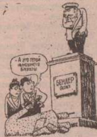
Рис. А. ЧЕРНЯК.